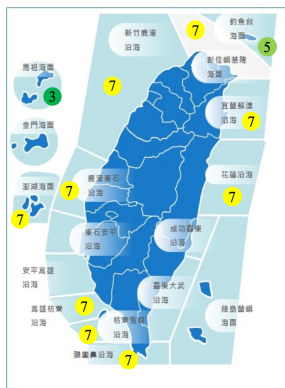
圖 1 臺灣海域海象災害風險分析結果

除了事前的規劃參考風險資訊，本研究運用中央氣象局海象測報中心已作業化運轉的波浪系集預報，加上預報中心的WRF風場系集預報，建立關鍵機率性預報資訊，提出預報機率的計算方式以及考量系集資料遺缺時之處理方式，利用短期海氣象機率性預報及長期氣候窗統計，建構一般航行安全條件，並考量臺灣海域作業條件及限制等特性(如離岸風機施工維運、海域拖吊、港灣沉箱布放、漁船及箱網作業、海域調查等)，依據前述作業條件利用蒙地卡羅模擬法進行強化學習，最後再套用氣象局風速及波高的系集資料，計算海上作業最佳期程以提供多用途決策判斷之運用，如圖2所示。